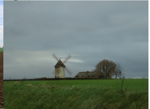
Les abords du monument