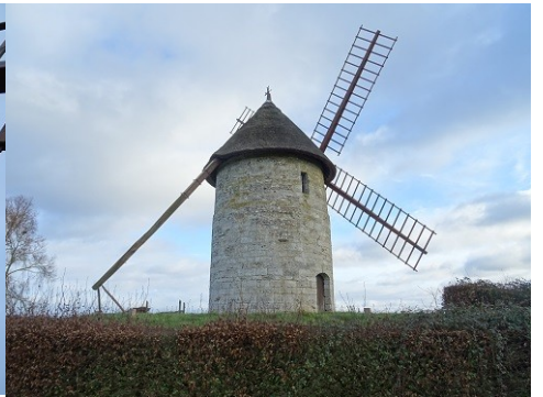
Vue du moulin